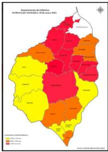
Tasa de incidencia Covid-19 por 100 mil habitantes. Municipios. Atlántico

“Por medio del cual se imparten medidas necesarias en materia de orden público para garantizar el cumplimiento del aislamiento selectivo y mitigar el riesgo de propagación y contagio del COVID-19 en el departamento del Atlántico”