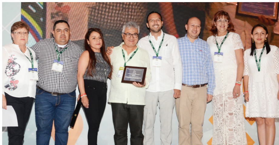
Entrega de la distinción al Presidente Ejecutivo por parte del Consejo Directivo Nacional de Acoltés