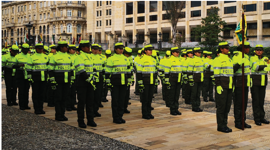
60 unidades conforman el Cuerpo Especial de la Policía de Tránsito de Colombia

la ilegalidad del mismo, comparado con el año inmediatamente anterior, se han realizado diferentes operativos, de los que surgen como resultados 10.529 vehículos inmovilizados por la práctica del transporte informal en la ciudad de Barranquilla y su área metropolitana.