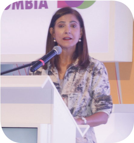
Ángela María Orozco Ministra de Transporte