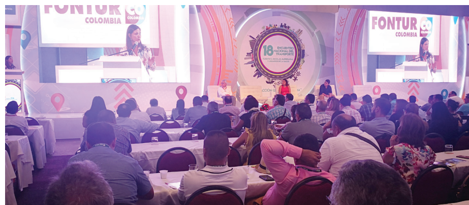
El recinto en pleno escuchó atentamente cada uno de los puntos planteados por la señora ministra durante su intervención

La titular destacó el logro del beneficio del IVA, por medio del artículo 11 de la Ley 1943 de 2018 la Ley de financiamiento, que podrá ser aplicado para las ventas hechas a pequeños transportadores propie-