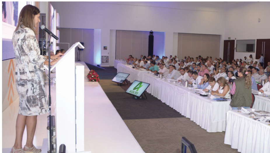
Durante su intervención la ministra de Transporte destacó compromiso de esta cartera para la renovación del sector, crear un sector fuerte, transparente y formal.

de julio, en conjunto con las oficinas jurídicas de los ministerios de Hacienda y Transporte.