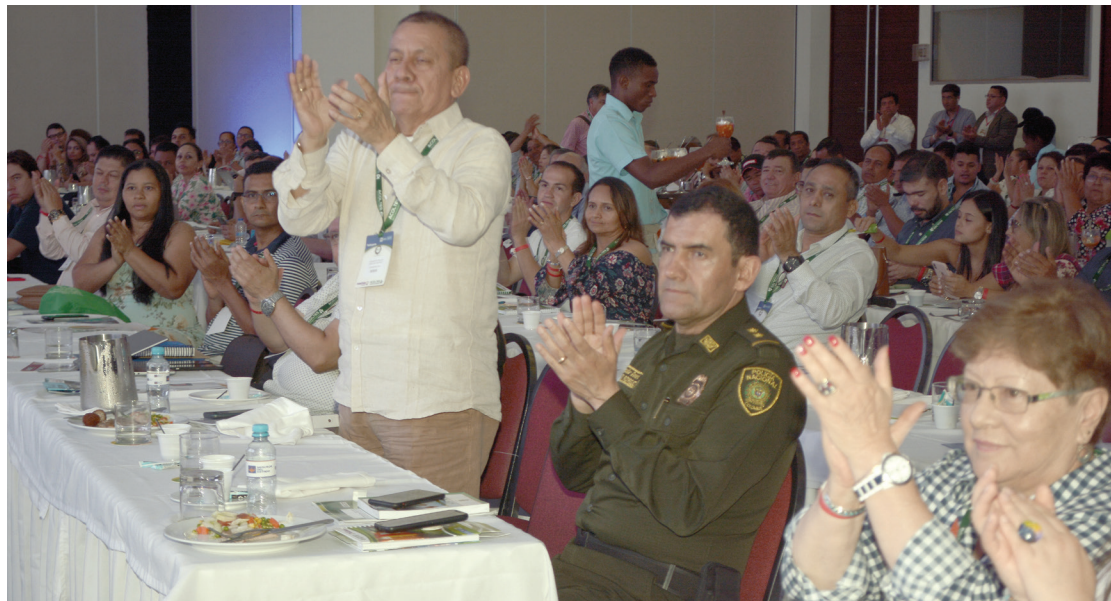
Al término de la presentación de la superintendente de Transporte, Carmen Ligia Valderrama, el público asistente celebró, en medio de aplausos, los nuevos cambios de la entidad.

esa competencia de protección que está implícita en la Superintendencia y se creó la Delegatura de Protección de Usuarios del Sector Transporte, en donde, además, se trabajarán campañas de prevención para el mejoramiento de la información y amparo de los consumidores en este sector.