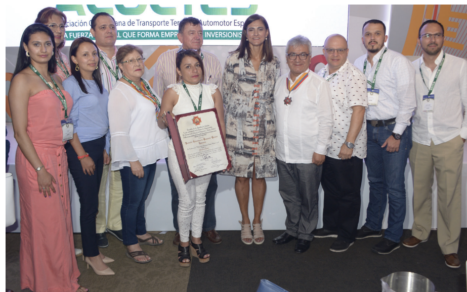
Directivos y gerentes de empresas asociadas a Acoltés, tuvieron la oportunidad compartir y dialogar con la señora ministra después de su intervención en el evento ferial

Para terminar su intervención la ministra de Transporte se refirió al empeño de esta cartera para la renovación del sector, crear un sector fuerte, transparente y formal, para lo que destacó el compromiso del gobierno que trabaja sobre las bases de la legalidad en todos los aspectos que permitan el desarrollo positivo que todos los actores visualizan para el transporte de país.